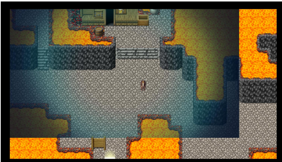
Figura 1 - Filtro azul ilha Ushua